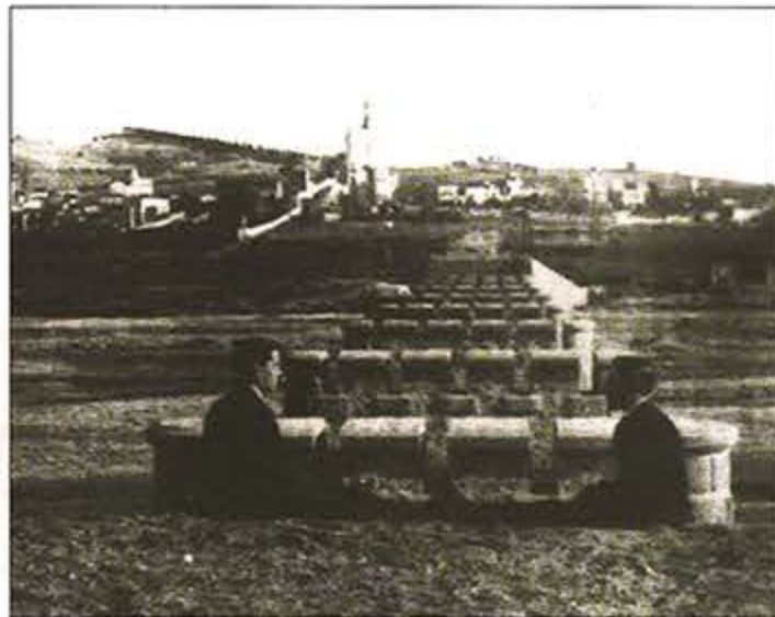
L'estructura del pont vell que va trigar vuit anys a fer-se.