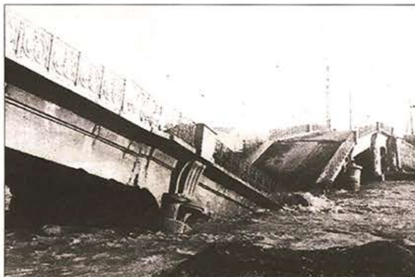
Una besosada va fer caure el pont l'any 1943.

poble era la comunicació amb el seu entorn. No hi havia cap pont sobre el Besòs que connectés amb Barcelona, només unes passeres de fusta per anar a peu i calia desplaçar-se a Sant Adrià per agafar el tramvia. La construcció d'un pont esdevé una infraestructura estratègica per al poble i les gestions de Llorenç Serra amb la Diputació de Barcelona fan que el 31 de desembre de 1913 es posi la primera pedra.