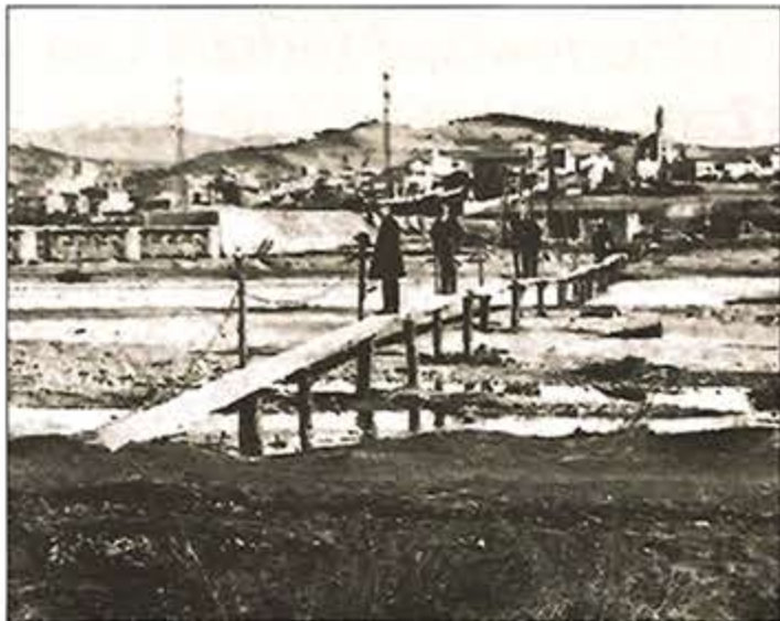
La passera era la manera de travessar el riu abans de 1921.