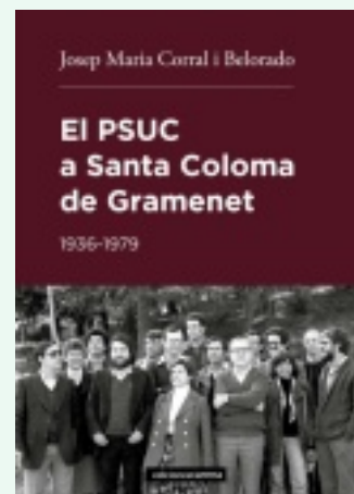
coberta del llibre sobre el PSUC

Tema. La primera feina d'un historiador quan entra a la cuina és delimitar bé el tema i el període temporal a historiar. Les tres branques de la policia espanyola (Guàrdia Civil, Policia Armada / Policia Nacional i Cos General/Superior de Policia, inclosa la famosa Brigada Política Social de la dictadura) entre el 1939 i el 2024. El periodisme social a Barcelona entre el 1966 i el 1983. El PSUC a Santa Coloma de Gramenet entre el 1936 i el 1979. Les Cases Barates entre el 1900 i el 1945. Si és una obra en diferents volums, caldrà delimitar-los. La història de la UGT de Catalunya entre el 1888 i el 1936; els anys de la guerra; del 1939 al 1976. Així i tot, els temes delimitats han de ser tractats sempre dins el seu context, això és bàsic. També és important de calcular amb sentit de la realitat l'espai a dedicar a cada apartat del tema estudiat: el volum sobre la UGT de la guerra (només tres anys) és tan o més gruixut que el de la UGT anterior (48 anys) i el de la UGT durant el franquisme (37 anys). Un cop ben delimitat globalment el tema de l'obra a cuinar, cal repetir l'operació en cada capítol i així crear l'estructura del llibre, que no ha de ser un guió de ferro, sinó que pot canviar una mica durant les fases de la recerca i la redacció.