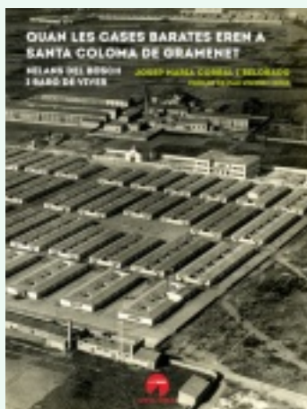
coberta del llibre sobre les Cases Barates