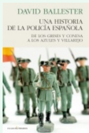
coberta del llibre sobre la policia

Redacció. El gremi dels historiadors, en última instància, produeix més que res llibres i articles; però què és el que singularitza l'escriptura dels historiadors? A veure. L'escriptura és sempre un procés, que té tres fases que responen a aquests tres verbs: preescriure, escriure i reescriure. Escriure, és a dir, fer el primer redactat, i reescriure, o sigui, polir-lo fins a donar-lo per bo, són feines que no singularitzen l'historiador, perquè les fa de la mateixa manera que els altres professionals que escriuen. Ara bé, la preescriptura, que és tot allò que hem de fer abans d'escriure la primera paraula d'un llibre, sí que és específica dels historiadors: abans de redactar la primera ratlla d'un llibre, l'historiador ha hagut de fer una gran feina de recerca. Aquesta és la singularitat de l'escriptura de l'historiador. Després, és clar, com tothom, haurà d'escriure i reescriure amb rigor, amb claredat, amb amenitat.