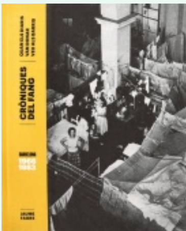
coberta de Cròniques del fang

Conclusions. Un cop llegit un llibre d'història, el lector l'ha de pair, és a dir, arribar a les seves pròpies conclusions. Fem-ho. A Santa Coloma de Gramenet, el PSUC va ser el partit de l'antifranquisme i va viure tres èpoques diferents: la guerra, la resistència (1939-1965) i la plenitud (1965-1979). La segregació de les Cases Barates del terme de Santa Coloma la vol tothom, la prova és que són dos ajuntaments colomencs de diferent signe polític els que diuen sí a l'agregació a Barcelona, l'ajuntament de Gramenet del Besòs de la República en guerra l'any 1937 i l'ajuntament feixista l'any 1941. Confirmat: la vigília d'una festa és millor que la festa mateixa: l'ambient que van viure de bracet entre el 1966 i el 1983 el periodisme social i el moviment veïnal va ser millor que el que ha vingut després: una època daurada que va omplir els barris de millores i els cors d'esperances. La història de la policia espanyola després de la guerra i fins ara és la història d'un horror, amb unes línies de continuïtat que travessen la dictadura, la transició, els governs socialistes i els del PP: brutalitat, incompetència, morts a trets, tortures, adscripció a l'extrema dreta, impunitat, amb ministres de l'Interior sovint nefastos. Una història terrible, però que algú havia d'explicar.